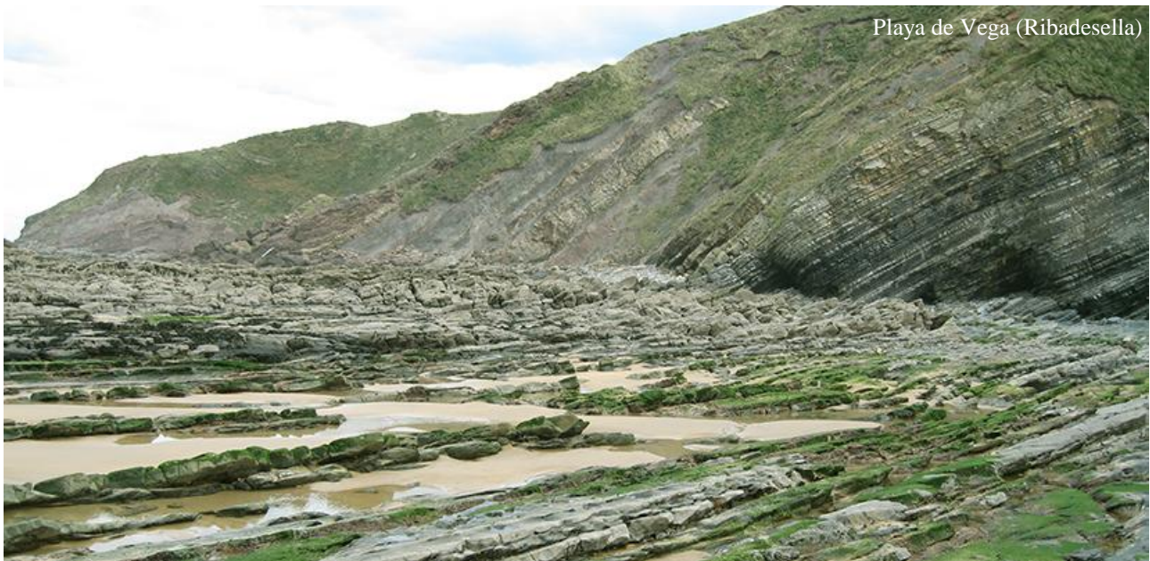
Playa de Vega (Ribadesella)

A2. Series terrígenas fluviales del Kimmeridgiense: el inicio del rifting del Jurásico Superior-Cretácico Inferior, facies de canales meandriformes, paleosuelos, icnitas de dinosaurios, palinología.